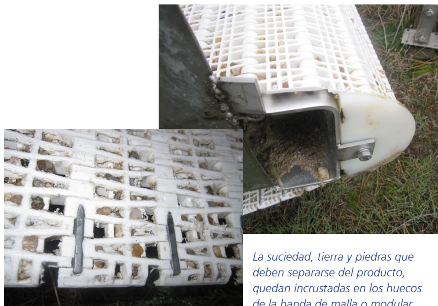
La suciedad, tierra y piedras que deben separarse del producto, quedan incrustadas en los huecos de la banda de malla o modular.

La elasticidad y el diseño de Washflow ® disminuye la acumulación de restos, facilita su liberación y mantiene el caudal de drenaje.